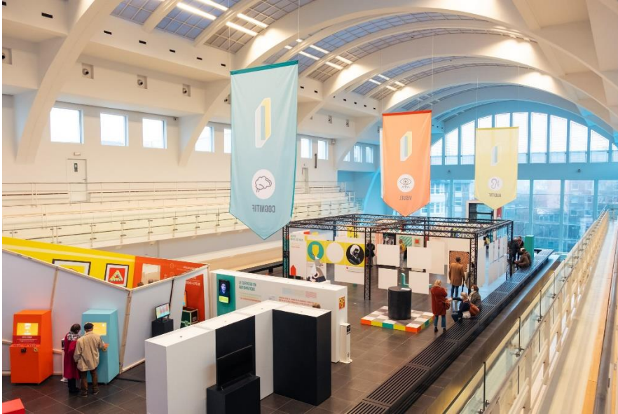
Foto van de tentoonstelling Illusies in La Cité Miroir in 2021

Door deze vier zones te verkennen, worden de bezoekers uitgedaagd hun zekerheden in twijfel te trekken en zich meer bewust te worden van de mechanismen die hun denken sturen.