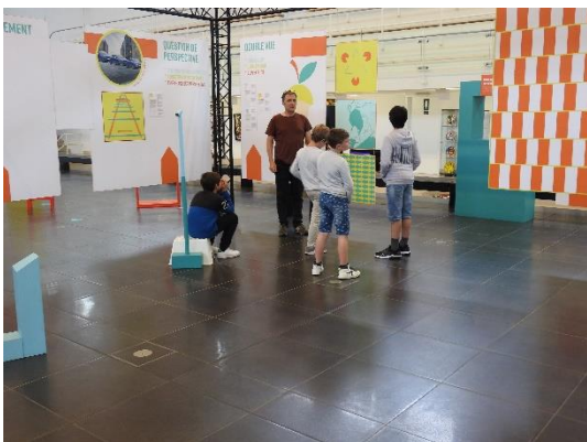
Foto van de tentoonstelling Illusies in La Cité Miroir in 2021