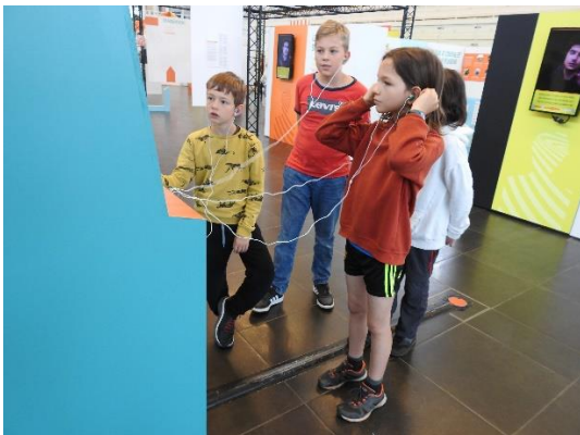
Foto van de tentoonstelling Illusies in La Cité Miroir in 2021