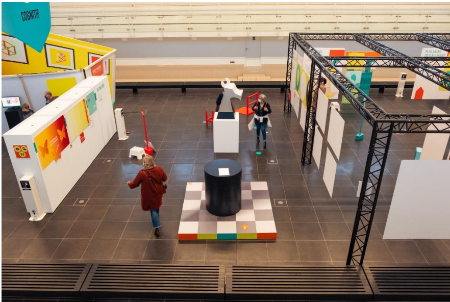
Foto van de tentoonstelling Illusies in La Cité Miroir in 2021