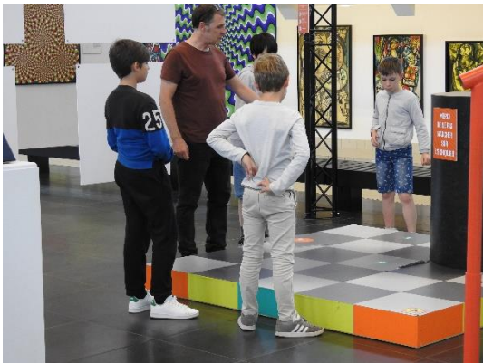
Foto van de tentoonstelling Illusies in La Cité Miroir in 2021

Deze laatste fase is volledig ingebed in een systeem van laïciteit, bedoeld om kritisch denken, nuance, debat en respect voor standpunten te bevorderen, binnen de context van samenleven en een meer rechtvaardige en humanistische samenleving. Het Centre d'Action Laïque van de provincie Luik wil hierbij ook een synthese en aangenaam hulpmiddel aanbieden aan zowel burgers als de educatieve sector om de thema's van de tentoonstelling in groepsverband aan te pakken.