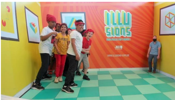
Foto van de tentoonstelling Illusies in La Cité Miroir in 2021