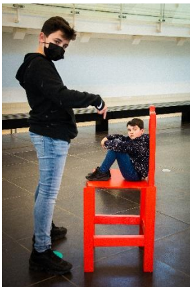
Foto van de tentoonstelling Illusies in La Cité Miroir in 2021